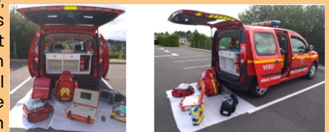
LE VEHICULE VISU ET SON EQUIPEMENT DE BASE

Ainsi à Nontron, les pompiers peuvent embarquer une valise de télémédecine à bord de leur véhicule d'intervention d'urgence. Le dispositif, doté d'une liaison 4G, transmet les images et données en temps réel sur l'état de santé d'un patient lors