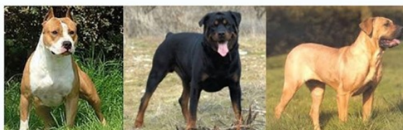
Race American Staffordshire terrier