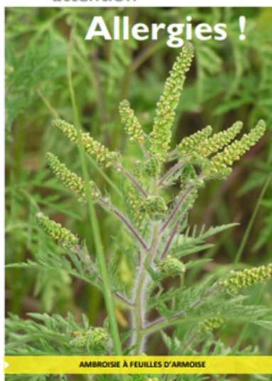
AMBROISIE À FEUILLES D'ARMOISIE